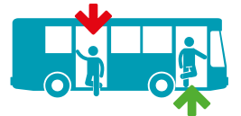
SALIRE SEMPRE DALLE PORTE ANTERIORI E SCENDERE DA QUELLE POSTERIORI