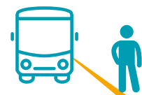
RIMANERE SUL MARCIAPIEDE FINO A QUANDO L'AUTOBUS È FERMO