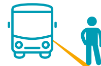
RIMANERE SUL MARCIAPIEDE FINO A QUANDO L'AUTOBUS È FERMO