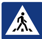
RIGHE BIANCHE: PASSAGGIO PEDONALE