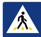
RIGHE GIALLE: PASSAGGIO PEDONALE RISERVATO AL PERSONALE AUTORIZZATO