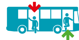
SALIRE SEMPRE DALLE PORTE ANTERIORI E SCENDERE DA QUELLE POSTERIORI