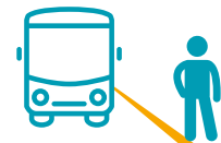
RIMANERE SUL MARCIAPIEDE FINO A QUANDO L'AUTOBUS È FERMO